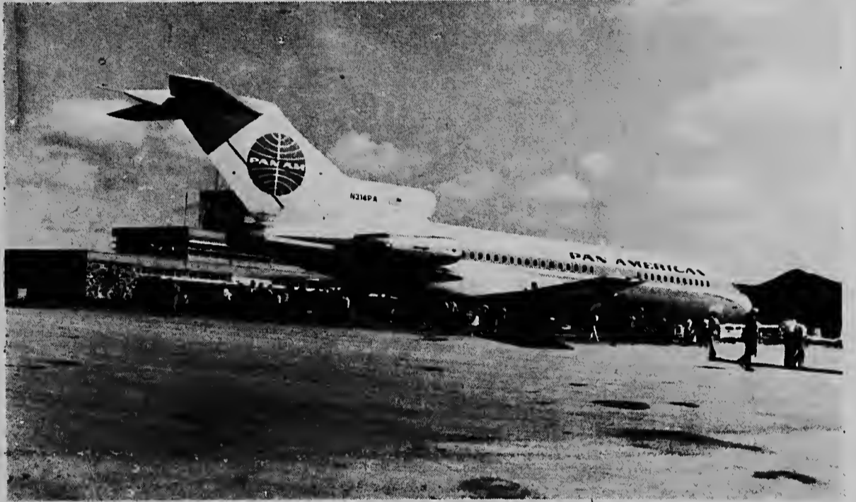
Esaki ta e promer PANAM-Jet Boeing 727 ora qu el a baha pa promer biaha na Sint Maarten dia 18 di e luna aki riba Julianavlegveld pa e vuelo di prueba.

E promer ministro a yama un reunion di gabinete y despues di un consulta liber cu e miembronan, el a anuncia su renuncia.